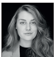
Mille Lambert Ensemble