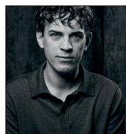
Emil Prenter Che