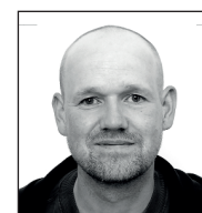
Lars Gaarde Lyddesign