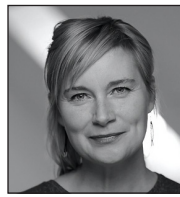
Helle Damgård Kostumedesign