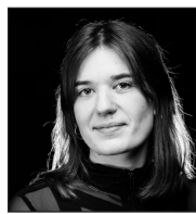
Scenografi Laura Løwe